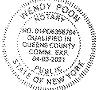
Stamp, Notary Public